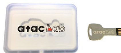
OAK Cam USB メモリ版